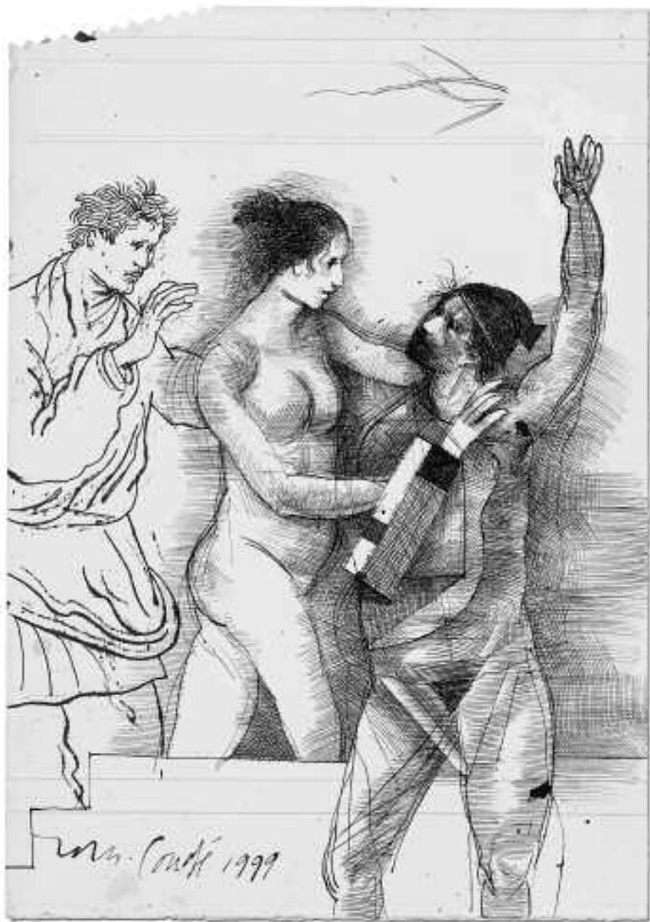
Sin título, 1999 Pluma y tinta 34 x 24 cm