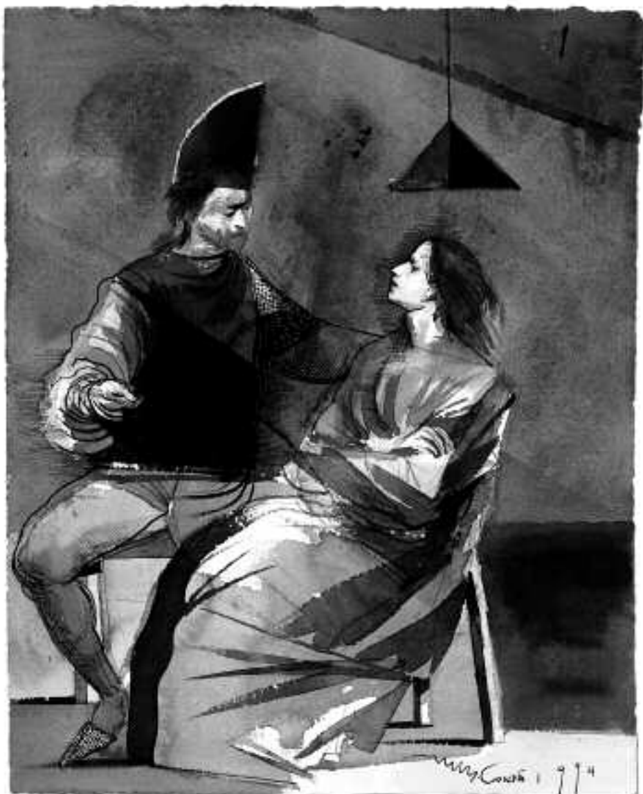
Sin título, 1994 Acuarela 41,5 x 33,5 cm