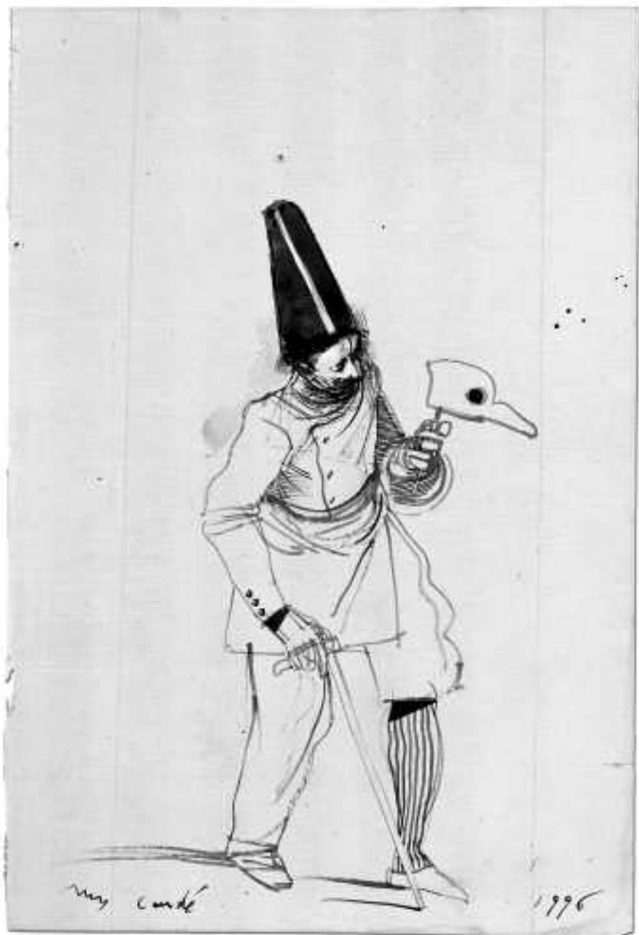
Sin título, 1996 Pincel y acuarela 30 x 20,5 cm