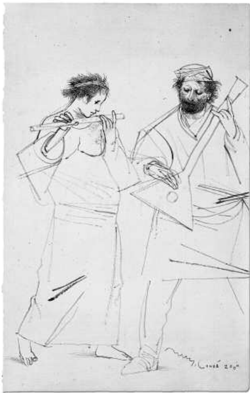
Sin título, 2000 Pincel y acuarela 40 x 25,5 cm