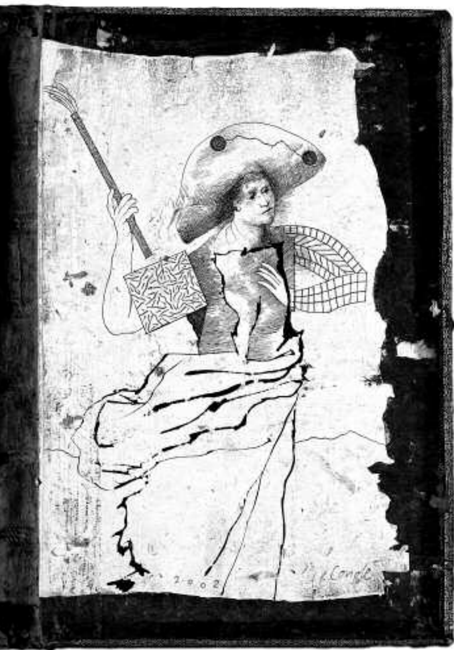
o, 2002 de libro del siglo XVIII 63 cm