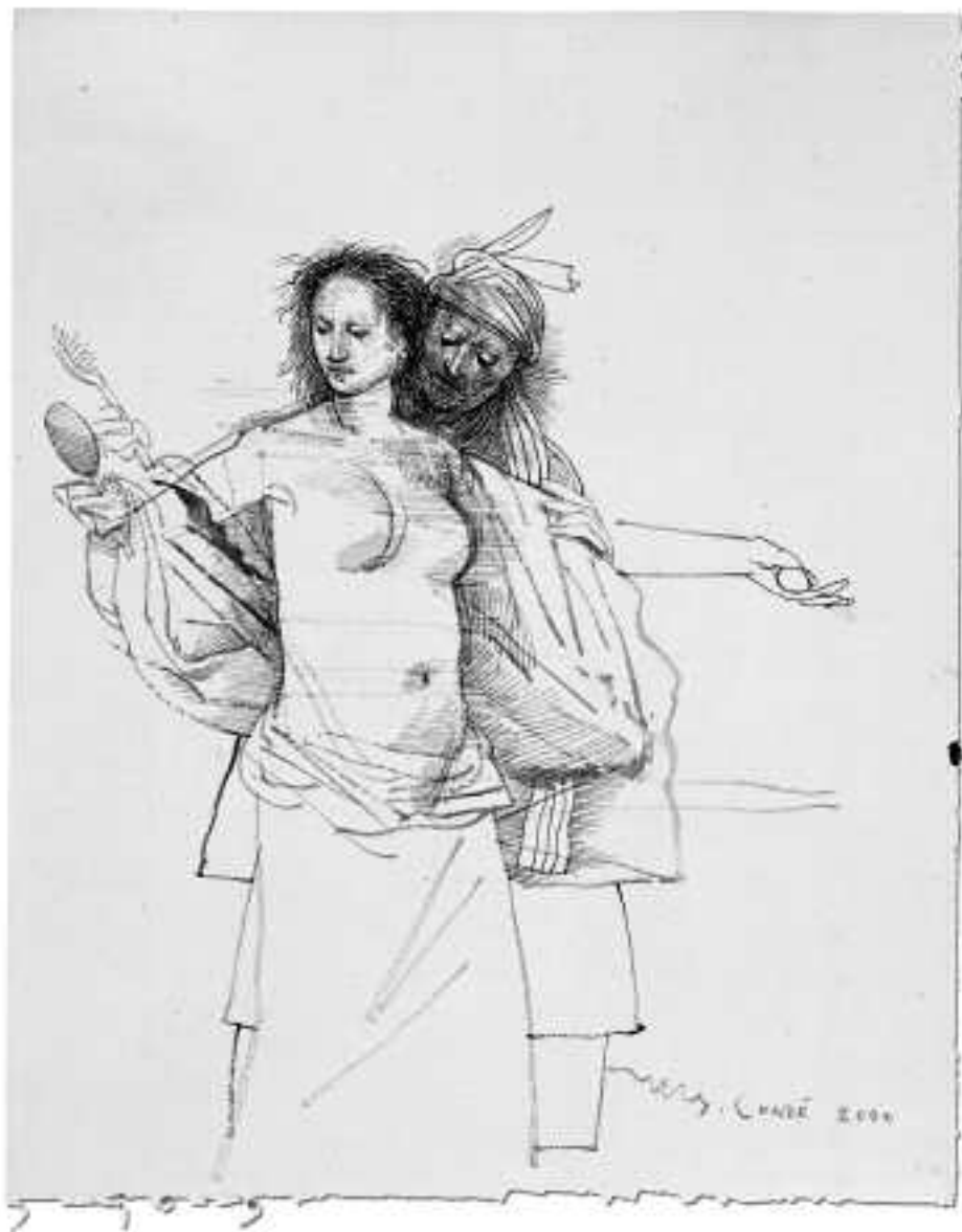
Sin título, 2000 Pincel y acuarela 32 x 25,5 cm