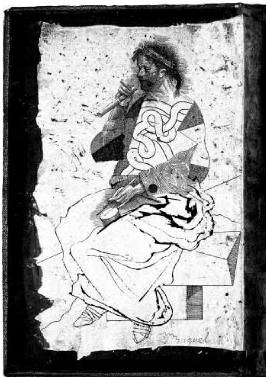
Sin título Tinta china sobre tapa 45 x 45