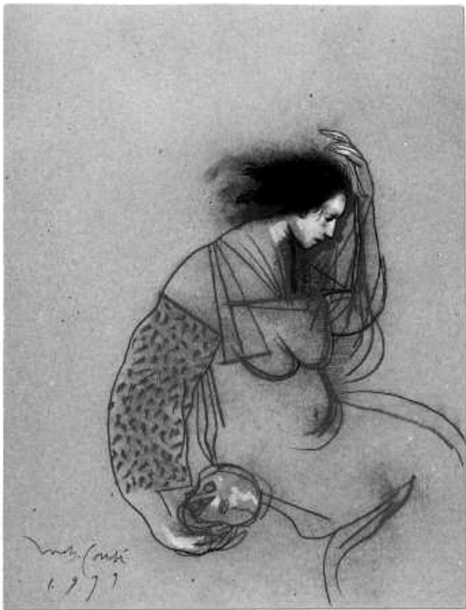
Sin título, 1999 Conté, pastel y carboncillo 64 x 49 cm